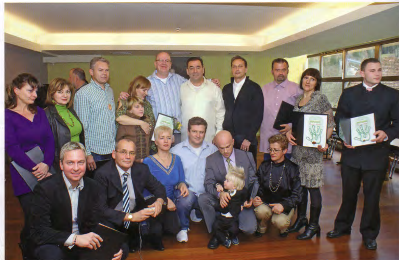
▲ Generacija diplomata Škole bioenergije po Zdenku Domančiću u Bohinjskoj Bistrici prosinca 2009. godine.

Liječenje bioenergijom je sve priznatije u svijetu, a zahvaljujući čuvenim bioterapeutima poput našeg Zdenka Domančića postiglo je veliki ugled. Kako to pravno izgleda, što je još preporučljivo i kako se treba kloniti lažnih psihoterapeuta obavezno pročitajte u nastavku.